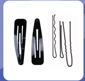
Accesorios para el cabello