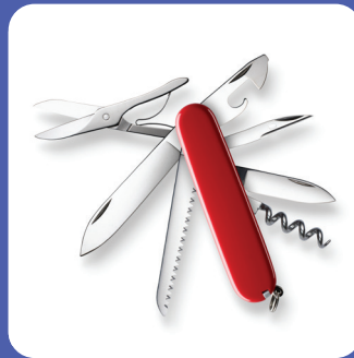
Navaja de bolsillo