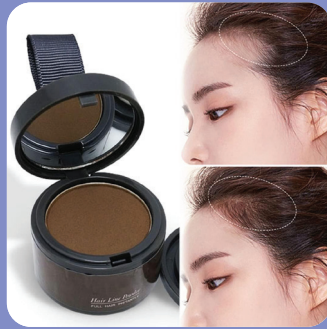
Covertura de raíces