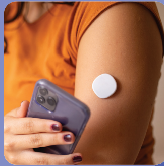
Monitor continuo de glucosa